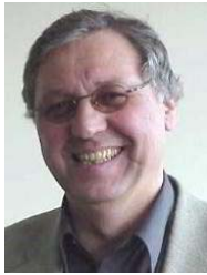
Vorsitzender moodleSCHULE e.V.

Hat Ihre Arbeit in den letzten Jahren zugenommen?